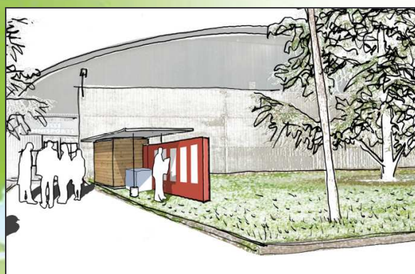
Le module pendant la Foire de Saint Etienne