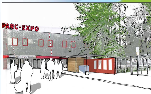
Le module « passif » ossature bois et ses panneaux d'exposition pendant le salon de l'immobilier et des énergies renouvelables

Trois semaines plus tard, pendant la Foire de Saint Etienne, ce sera la fin du suspense avec l'ouverture du module « passif », et la pesée de la glace (s'il en reste), sous le contrôle d'un huissier. De nombreux lots en lien avec la maîtrise de l'énergie ou le bois viendront récompenser les heureux gagnants.